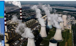
ПРИНЦИПИ ТА ПРАКТИКИ РЕСУРСОЕФЕКТИВНОГО ВИРОБНИЦТВА