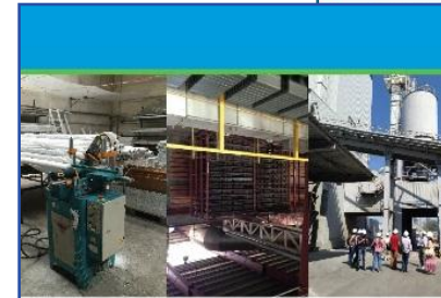
Принципи та практики ресурсоефективного виробництва